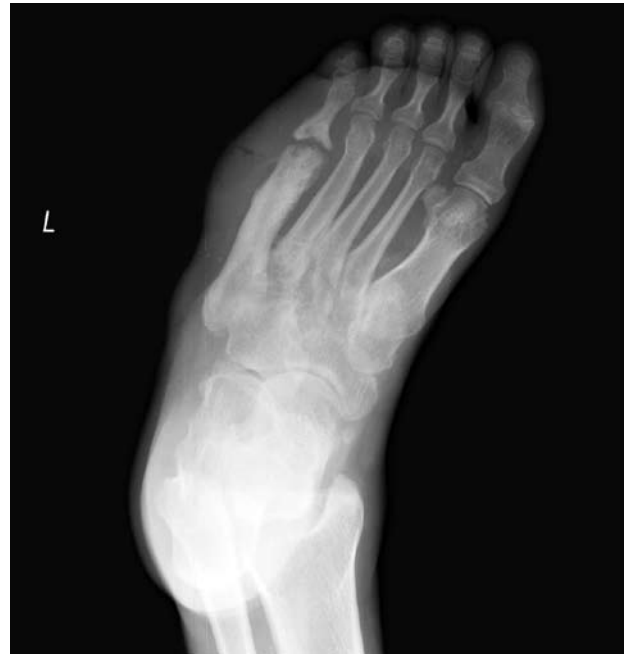
Şekil 2. Sağ ayak 5. metatarsofalangeal eklemden septik artrit sekeline bağlı deformasyon ve komşuluğundaki metatarsta osteomyelit görüntüsü.

Romatizmal ateş, akut juvenil artrit, romatoid artrit, kristal artropati, reaktif sinovit, viral artritler (hepatit B, rubella, kabakulak), osteomyelit, selülit, travmatik hemartroz, rüptüre olmuş Baker kisti, derin ven trombozu, pigmente villonodüler sinovit ayırıcı tanıda düşünülmesi gereken hastalıklardır. [13]