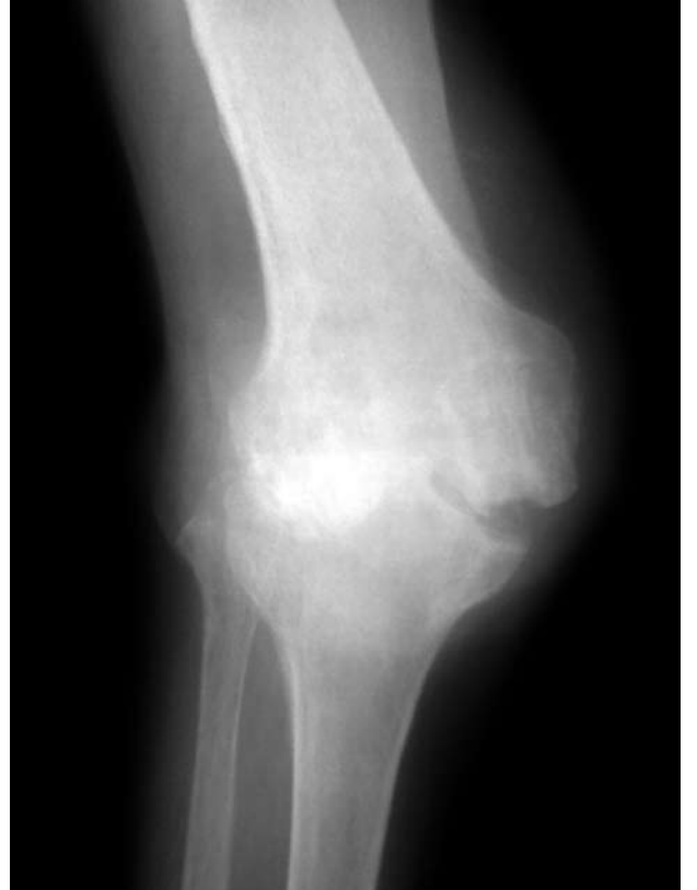
Şekil 3. Yetmiş iki yaşındaki bayan hastada septik artrit sekeli olarak diz eklemde kemik yapı hasarı ve subluksasyon görülüyor.

Antibiyotik seçiminde, her hastanenin kendi enfeksiyon kontrol komitesine danışılmalıdır. Ama genelde beş yaşın altındaki çocuklarda 2. (cefuroxime) ve 3. kuşak (ceftriaxone) sefalosporinler kullanılabilir. Beş yaşın üstündeki çocuklarda ve yetişkinlerde Gram boyasında